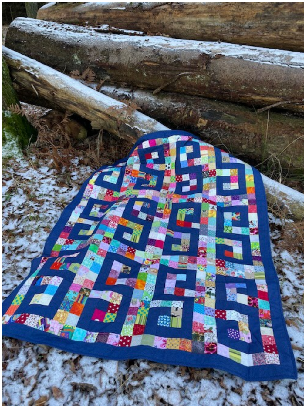
Foto taget ved Frisenborg skoven.

Der er brugt en masse firkanter og ind imellem blå stolper som danner de store "S"