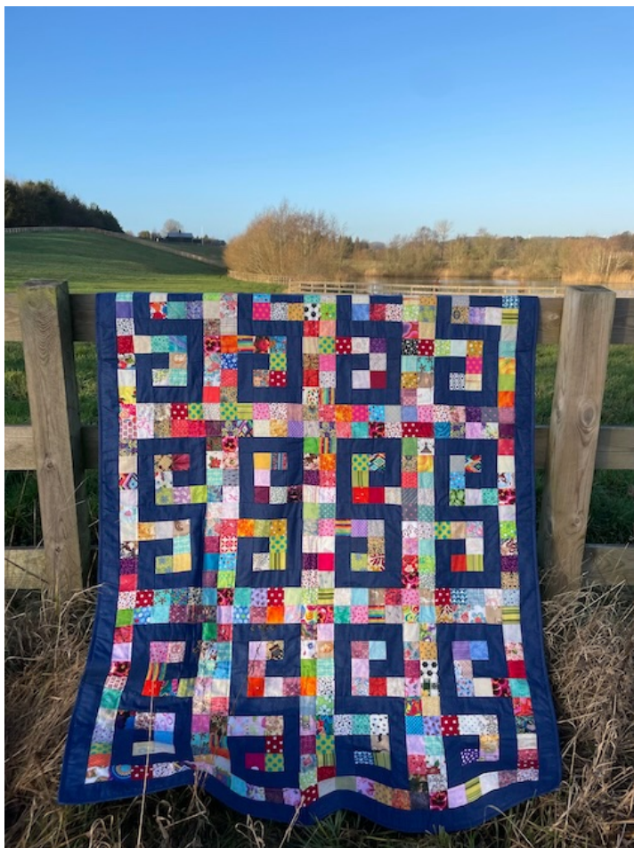
Foto taget ved Svejstrup.