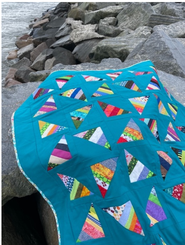
Foto taget ved Sæby