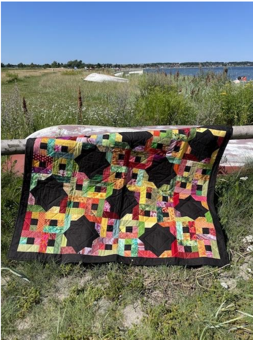
Foto taget ved As Vig.

Har quiltet diagonalt med en meleret quiltetråd i alle de glade farver og med en brun (bund stoffet) en firkant inden i den "store stjerne".