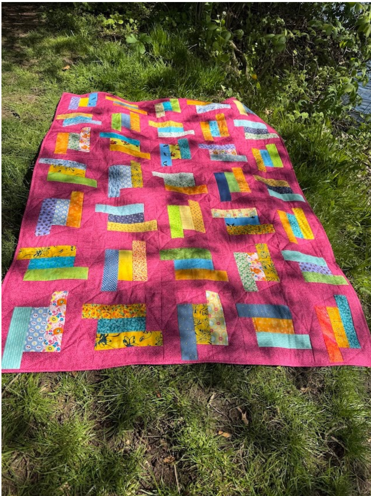
Foto taget ved Tange Sø strand

Til sidst afsluttet med en 6 cm pink lukkekant, der er syet på fra forsiden og stafferet fast på bagsiden i hånden.