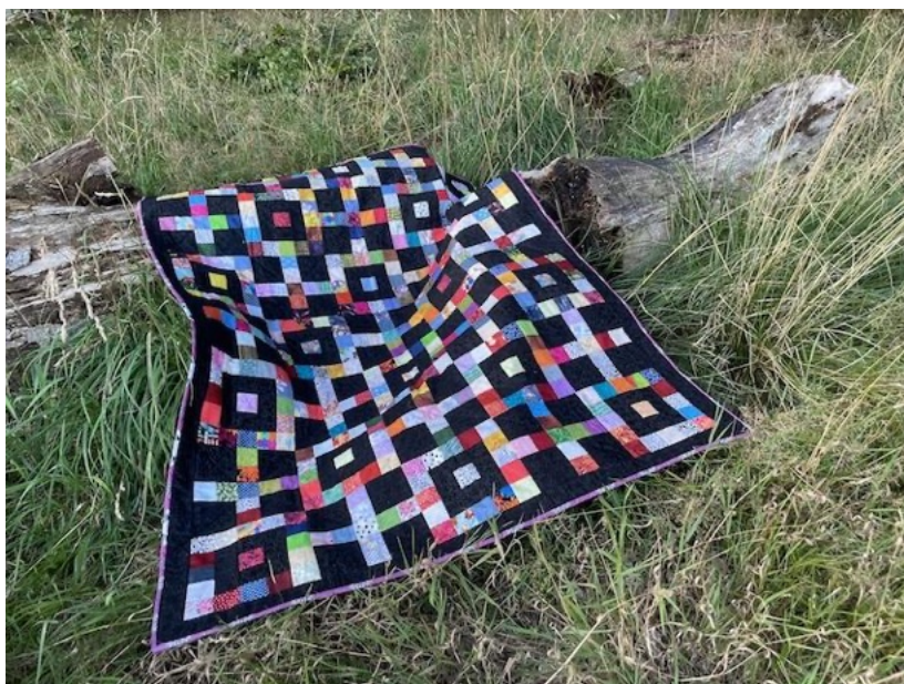
Foto taget i Vejerslev skov

Dette meget smukke restetæppe består kun af 2 blokke men giver en meget flot virkning da de "krydser" hinanden. Derfor var dette slumretæppe også nød til at hedde Langå tæppet.