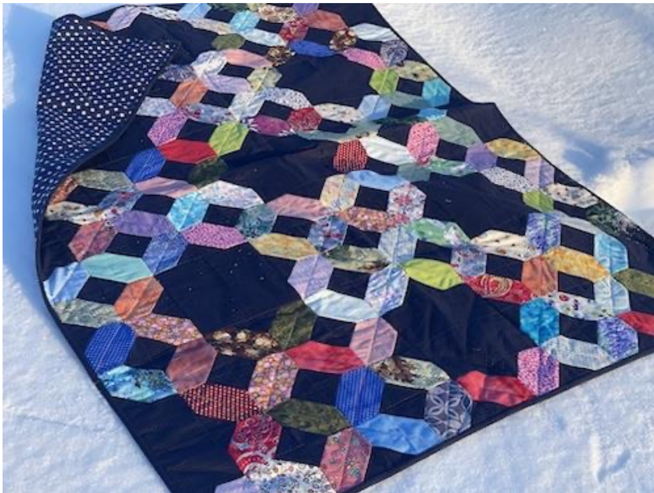
Foto taget ved Vejerslev kirke

Dette meget smukke restetæppe er kommet til at hedde Langeskov tæppet. Det har en meget smuk og enkel virkning og er syet af "kun" firkanter.