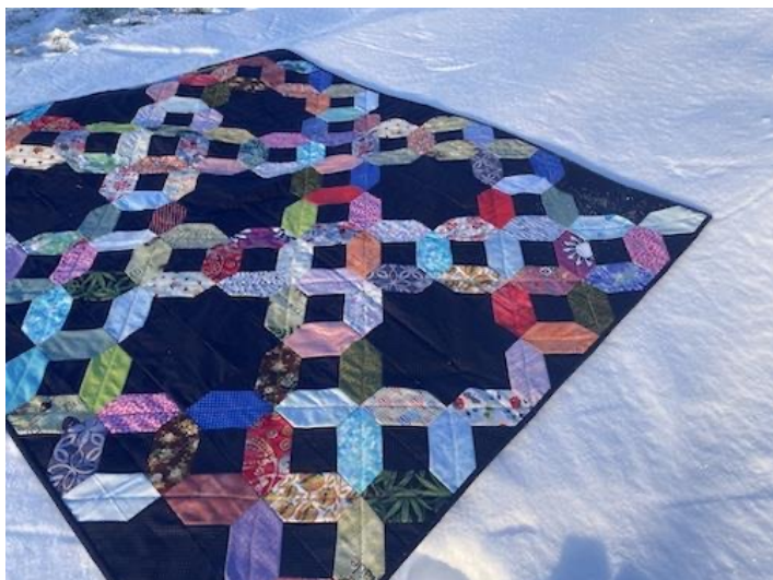
Foto taget ved Vejerslev kirke

Samlet tæppet med mellemfoer og bagside stoffet.